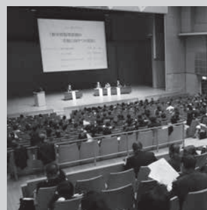
第21回教育セミナー